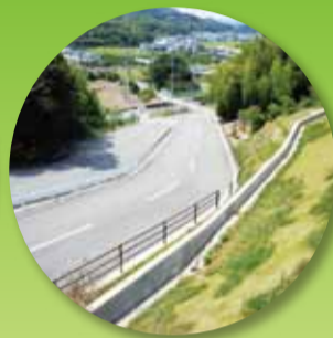
幅広い苑内進入道路