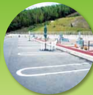
ゆったりと止めれる大駐車場

墓地のお引っ越しをお考えの方、ぜひ一度、ご相談ください。 ※古いお墓の引き取りも致します。