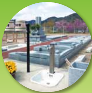
1列はさみに設置された水くみ場