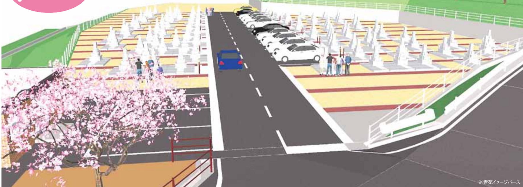
※霊苑イメージパース

永代管理墓 地蔵寺さま(四国曼荼羅霊場 第八十番札所)が春と秋の年2回、仏式にて法要を行います。